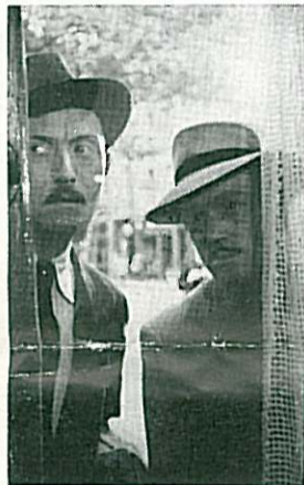
Les deux inspecteurs de la P. J. qui sont chargés de l'affaire.