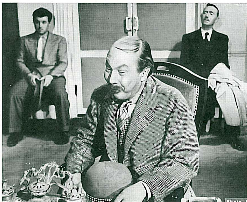
« Le Bouif » dans le cabinet du Juge d'instruction. On remarquera l'expression narquoise de l'inculpé.

l'assassinat de l'entraîneur et le silence du gagnant des six millions produits par le « report » maintenant célèbre. La femme de l'entraîneur et la seconde fille de Bicard, assistante d'un fakir à la personnalité douteuse, retiennent désormais l'attention des enquêteurs. Il semble que l'affaire soit entrée dans une phase définitive.