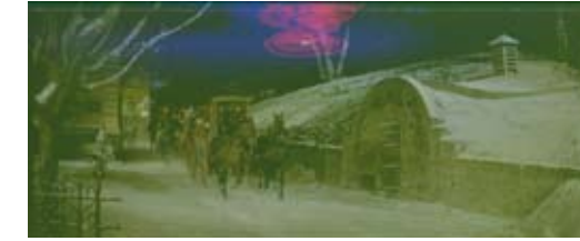
Fig. 2 : photogramme endommagé (en haut), après retouche (en bas).

La restitution des couleurs d'un film relève d'une théorie de la reproduction, mais elle touche aussi à l'esthétique. Une première approche a été de retrouver les caractéristiques de l'émulsion Eastmancolor de l'époque. Dans ce but, un premier tirage photochimique a été réalisé à partir du négatif original dont la colorimétrie n'était pas dégradée. Cette copie photochimique a servi de base pour l'étalonnage numérique. Nous ne disposions d'aucune copie de référence pour l'étalonnage, phase cruciale et éminemment subjective du processus de restauration.