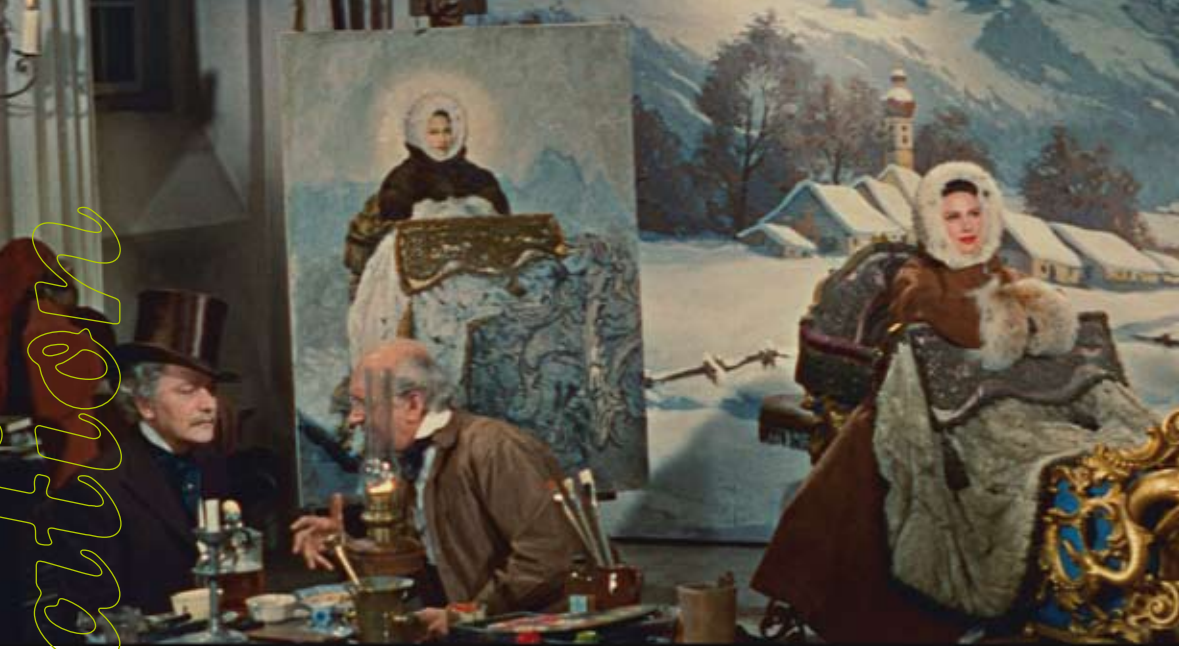
Anton Walbrook, Werner Finck et Martine Carol.