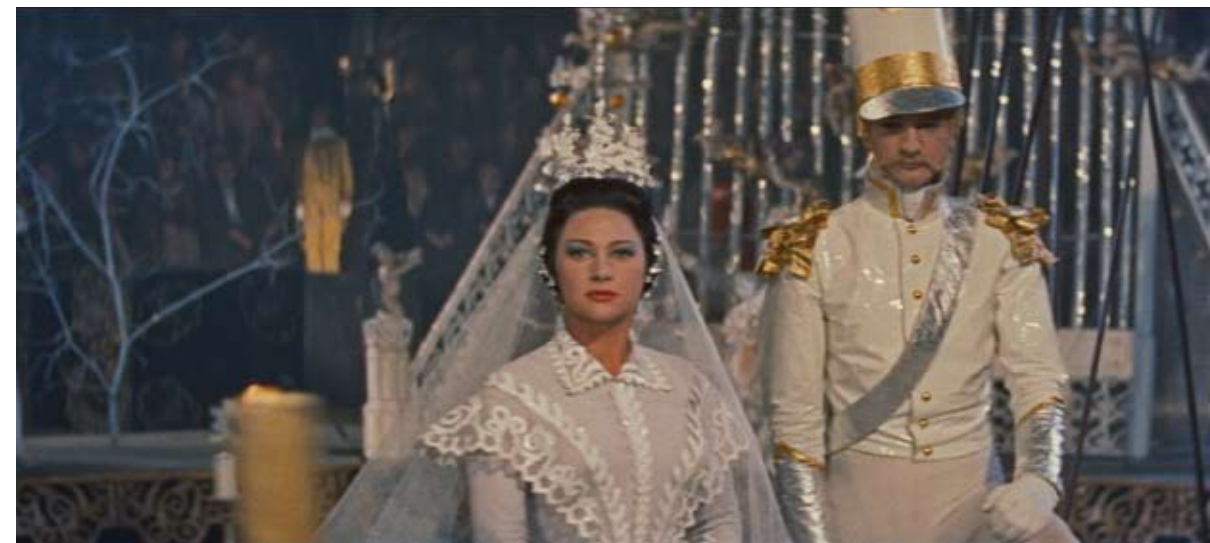
Tableau vivant of the marriage in the circus.