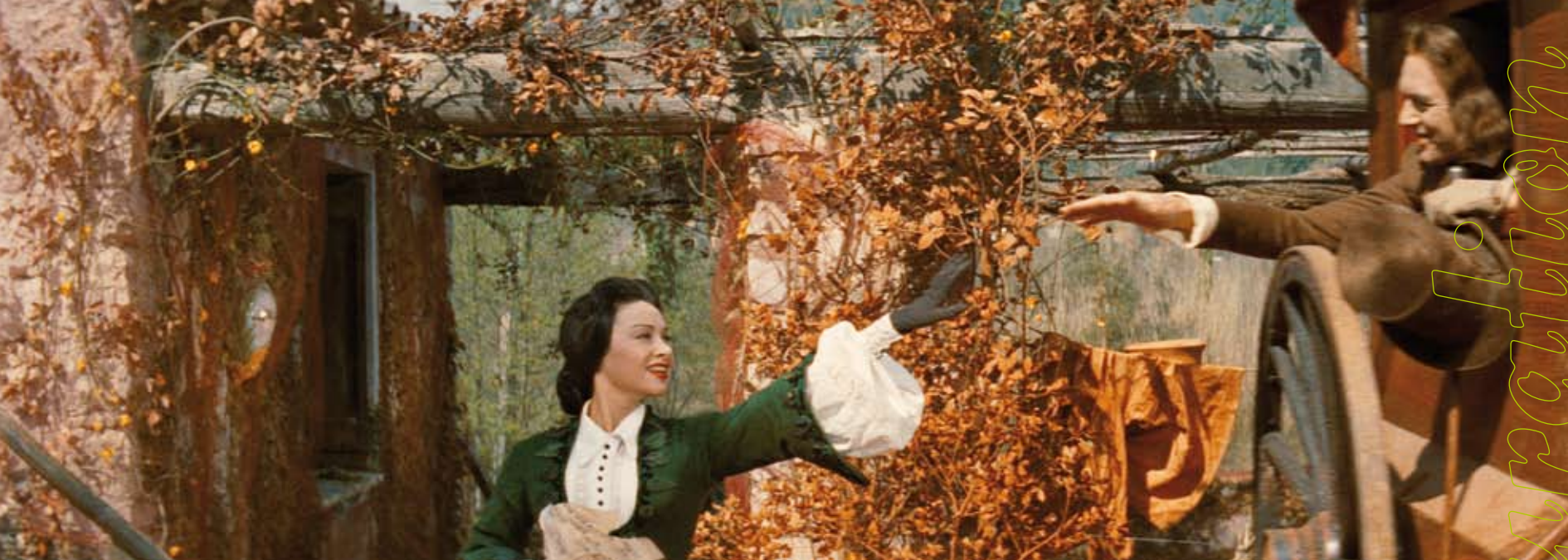
Fig. 4 : «couleurs automnales : comme les feuilles mortes, or, rouge, ocre et rouille». Max Ophuls.