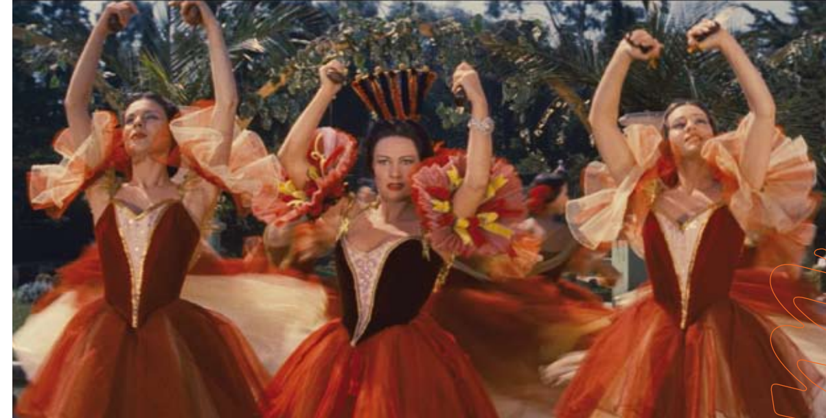
Lola danse au Tivoli.