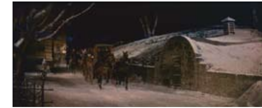
Fig. 2 : damaged frame before and after restoration.

restored. Forty years later, the film represented a puzzle for an entire restoration team. Apart from problems arising from the film's textual reconstruction, the film's physical restoration amounted to an anthology of all the technical problems one could encounter. For this reason, the option of digital restoration became the obvious choice. The current state of this technology allows us to use more or less automatic treatments to correct numerous surface defects (blotches, scratches, dust, friction marks) on old films. Most of the splices were damaged by emulsion tears and blotches [fig. 2]. Missing frames were reconstituted using interpolation techniques. Most of the material had highly heterogeneous photographic quality, and the black and white separations were printed out of register (color fringes). The restitution of colors to a film is a question of reproduction theory, but it also touches on esthetic matters. A first approach was to recover the features of Eastmancolor emulsion of the period. So a first photochemical print was made