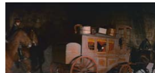
En haut : plan endommagé par plusieurs rayures. En bas : plan après restauration.