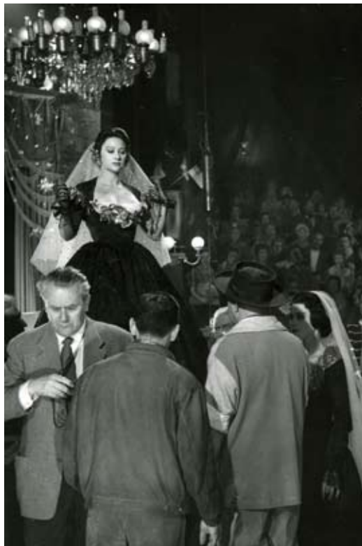
Mise en place d'un plan de Lola Montès. Set of Lola Montès.

Et c'est encore lui, bien sûr, qui en toute hâte, rassembla les noms prestigieux dont il est question ailleurs dans cette brochure, et dont il rédigea sans doute lui-même le manifeste. Le « Grand Public » ne