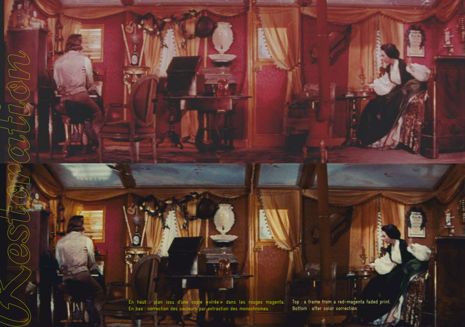
En haut : plan issu d'une copie «virée» dans les rouges magenta. En bas : correction des couleurs par extraction des monochromes.