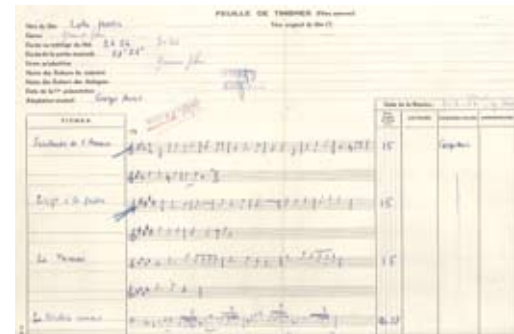
Partition de la musique originale de Georges Auric. Dépôt SACEM.